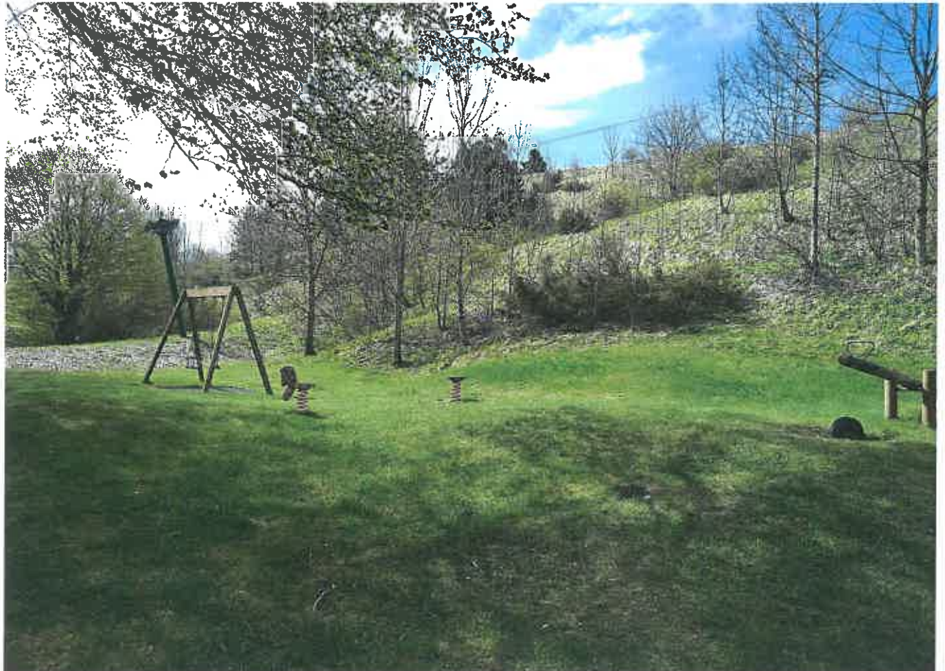
Area Giochi Brema