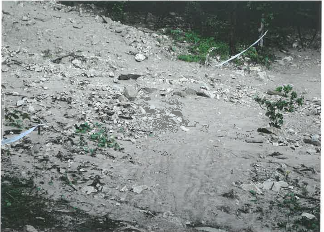
Fosso deve nou c'è più la passerella 2